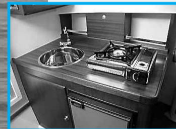
• Genoeg plaats om een hapje en een drankje klaar te maken.