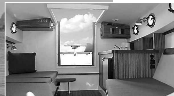
• De kajuit biedt veel ruimte en twee riante slaapplekken.

Maakt waar wat zijn markante uiterlijk belooft