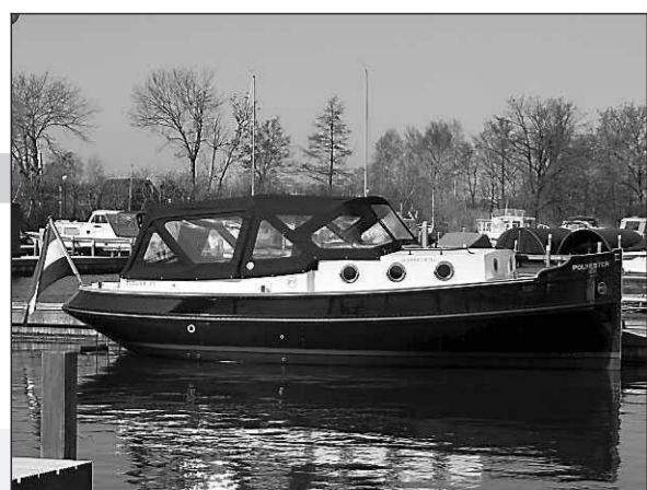
• Ook met kap ziet de sleper er stoer uit. Rechts: de toerenteller.