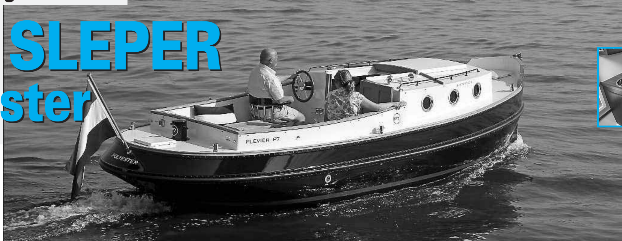
• Hollands glorie in een modern jasje.