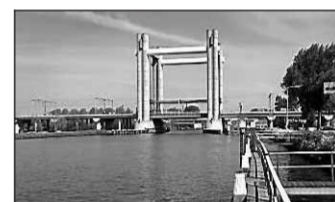
• De spoorbrug over de Gouwe.

...maar een tandje terug als je door het Rijnmondge- bied cruist deze zomer. De zeehaven- politie gaat tot en met augustus extra contro- leren op de recreatiewateren in het Rijnmondgebied. Het gaat om het Brielse meer, het Haringvliet en het Grevelin- genmeer. De zeehavenpolitie checkt watersporters op het dragen van een dodemans- koord (zodat de motor afslaat als je overboord valt), het (klein) vaarbewijs, te hard varen en varen op plaatsen waar dit niet is toegestaan. Info: www.zeehavenpolitie.nl